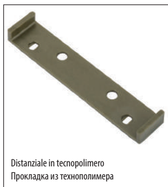
Distanziale in tecnopolimero Прокладка из технополимера