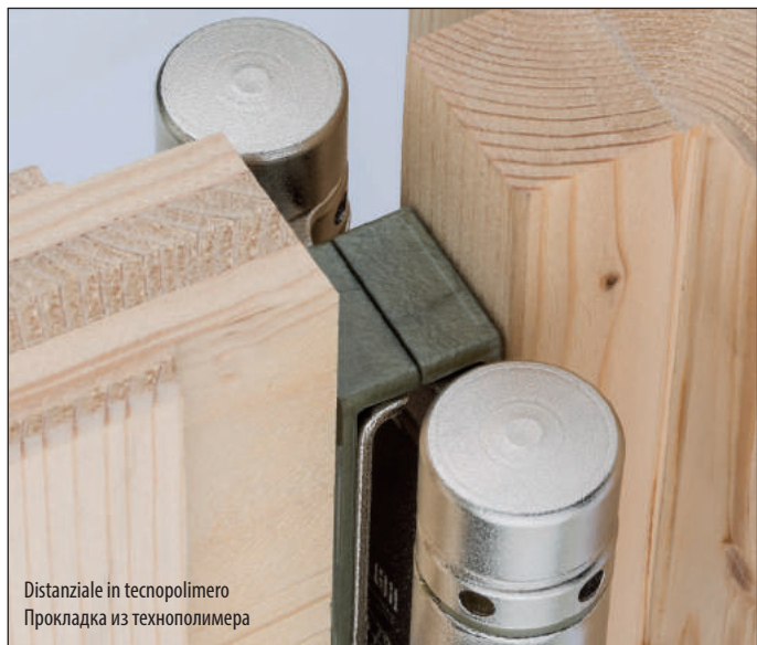
Distanziale in tecnopolimero Прокладка из технополимера