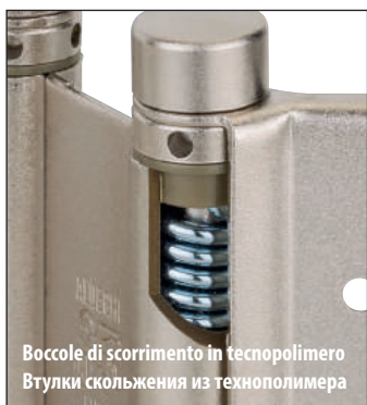
Boccole di scorrimento in tecnopolimero Втулки скольжения из технополимера

La continua azione di ricerca rivolta al miglioramento dei prodotti ha portato il reparto R. & S. di Aldeghi Luigi spa a riprogettare la conosciuta e apprezzata cerniera a molla doppia azione 101 con l'impiego di materiali di scorrimento innovativi e particolarmente performanti. La rotazione della cerniera avviene ora su boccole in polimero tecnico antifrizione, che garantisce una durata di oltre 200.000 cicli fornendo un funzionamento regolare e silenzioso. Grazie alla elasticità del polimero e alla speciale forma dei distanziali viene assicurata una funzione di ammortizzazione durante i movimenti che precedono l'arresto della porta: inoltre il contatto e l'aderenza tra i distanziali in posizione di porta chiusa garantiscono la corretta posizione della porta.