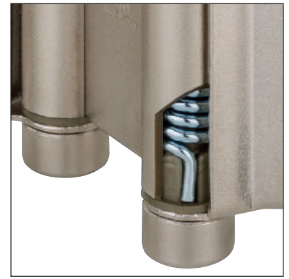
Boccole di scorrimento in tecnopolimero - Втулки скольжения из технополимера